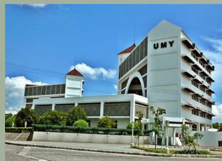
ムハマディア大学ジョグジャカルタ校