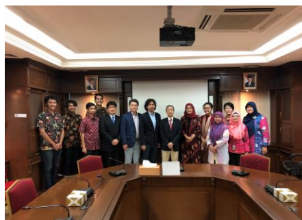
インドネシア労働省との会合

ムハマディア本部において主要55大学の学長出席の元、華々しく調印式が行われました。当日は、テレビ・新聞・雑誌の取材が入り、大きな期待感を実感できました！！