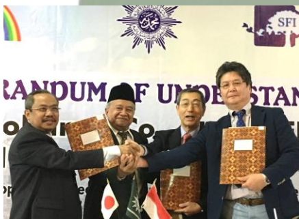
ムハマディアとの調印式